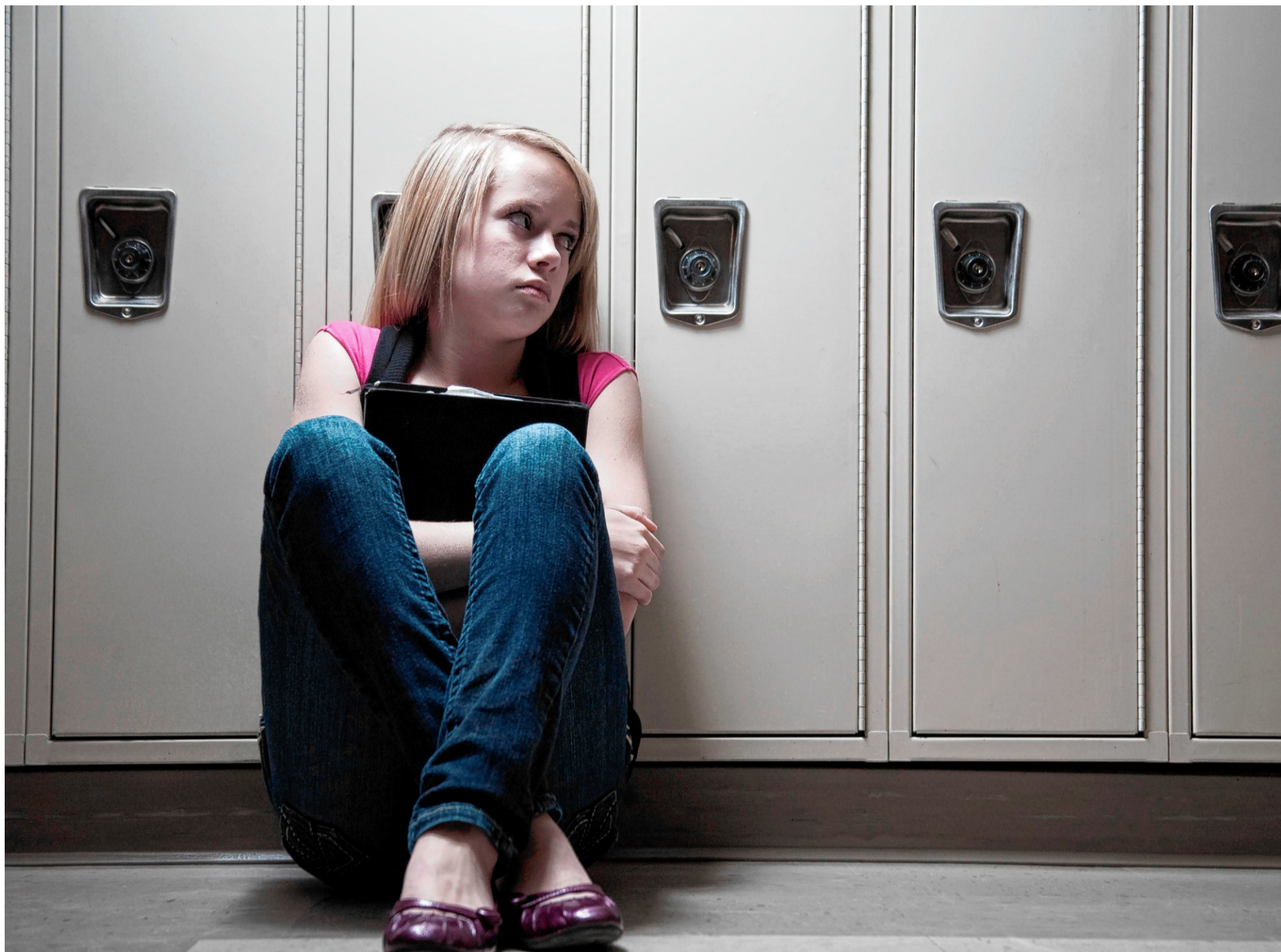
Schule kann auch zum Tatort werden. (Symbolbild)